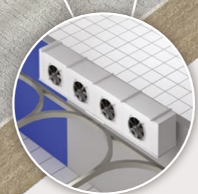
Évaporateur cubique NK 7 > 130 kW