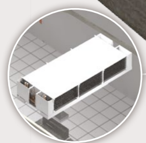
Évaporateur double flux GTA 11 > 82 kW