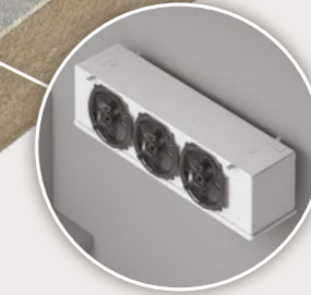
Évaporateur cubique 3C-A 1 > 35 kW