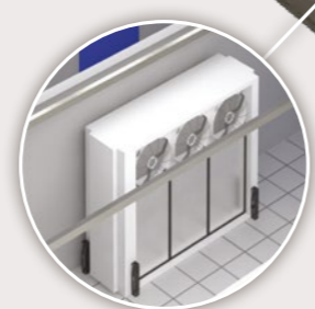
Évaporateur pour tunnel de surgélation NW 4 > 63 kW