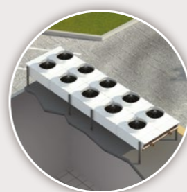
Aéroréfrigérant hélicoïde FC NEOSTAR 20 > 1200 kW