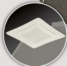
Cassette à eau glacée ARMONIA 1,3 > 11 kW