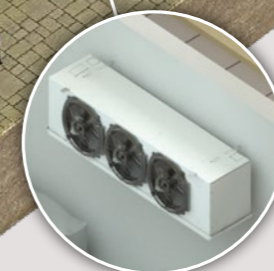
Évaporateur cubique 3C-A 1 > 35 kW