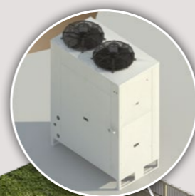
Groupe de condensation carrossé extérieur DUO CU 4 > 49 kW