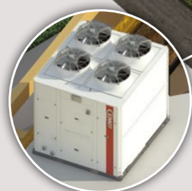
Groupes de production d'eau glacée et pompes à chaleur air/eau eCOMFORT 20 > 190 kW