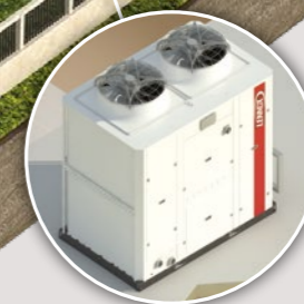
Groupes de production d'eau glacée et pompes à chaleur air/eau eCOMFORT 20 > 190 kW